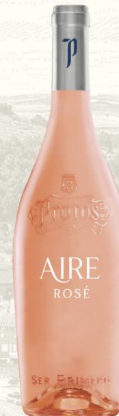
Aire de Protos Vino Rosado

DO: Cigales Uva: 85% tempranillo, 5% Garnacha, 5% Merlot y 5% Albillo Crianza: Corta en acero inoxidable Presentación: botella 750ml