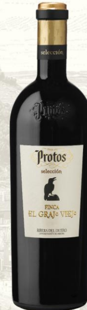
Protos Grajo Viejo Vino Tinto de autor

DO: Ribera del Duero Uva: 100% tempranillo Crianza: 18 meses en bodega de roble francés y 12 meses en botella