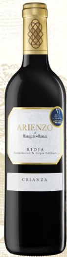
Marqués de Riscal Arienzo Vino Tinto

DO: Rioja Uva: Tempranillo Crianza: 17 meses en barrica roble americano Presentación: botella 750 ml