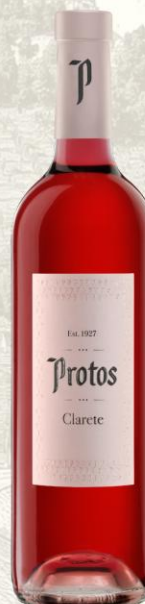
Protos Clarete Vino Rosado

DO: Rueda Uva: 100% Verdejo Crianza: 6 meses barrica de roble francés y 18 meses en botella Presentación: botella 750ml