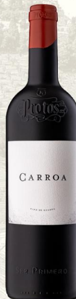
Protos Carroa Vino Tinto de autor

DO: Ribera del Duero Uva: 100% tempranillo Crianza: 16 meses bodegas de roble francés, 8 meses en tinajas de roble francés y un toque en huecos de hormigón