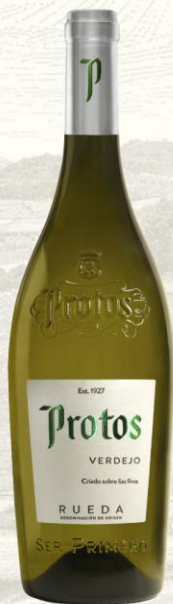
Protos Verdejo Vino Blanco

DO: Rueda Uva: 100% Verdejo Crianza: 3 meses sobre lías Presentación: botella 750ml