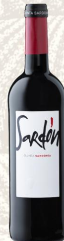
Sardón Vino Tinto

DO: Bierzo Uva: Mencía Crianza: 8 - 10 meses en barrica de roble francés Presentación: botella 750ml