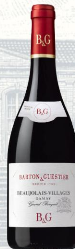
Beaujolais-Villages Vino Tinto

AOC: Bordeaux Uva: Sauvignon Blanc, Semillón y Muscadelle Crianza: Crianza en acero inoxidable sobre lías finas Presentación: botella 750ml