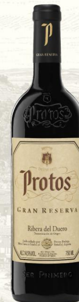
Protos Gran Reserva Vino Tinto

DO: Ribera del Duero Uva: 100% tempranillo Crianza: 14 meses en barrica roble francés y americano y 24 meses en botella Presentación: botella 375, 750 y 1,500ml