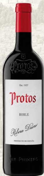
Protos Roble Vino Tinto