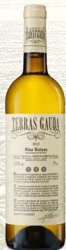
Terras Gauda Vino Blanco

DO: Rías Baixas Uva: 70% Albariño, 25% Caiño Blanco y 5% Loureira Crianza: Crianza sobre lías Presentación: botella 750ml y 1,500ml