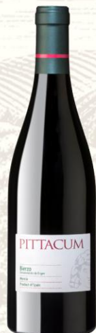
Pittacum Vino Tinto

DO: Bierzo Uva: Mencía Crianza: 3 meses en barrica de roble Presentación: botella 750ml