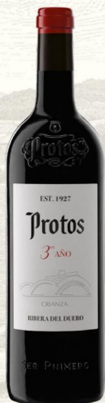
Protos Crianza 3er año Vino Tinto