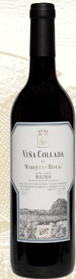
Marqués de Riscal Viña Collada Vino Tinto

DO: Rioja Uva: Tempranillo Crianza: 4 meses barrica Presentación: botella 750ml