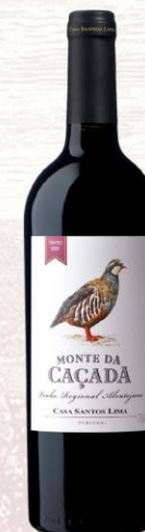
Monte da Caçada Vino Tinto

DOC: Vinho Regional Alentejano Uva: Syrah, Touriga Nacional, Petit Verdot y Alicante Bouschet Crianza: 7 meses en barrica de roble francés y americano Presentación: botella 750ml