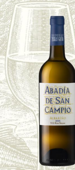
Abadía de San Campio Vino Blanco

DO: Rías Baixas Uva: 98% Caiño Blanco y 2% Albariño y Loureira Crianza: 2 meses sobre lías con batonnage + 6 meses en acero inoxidable Presentación: botella 750ml