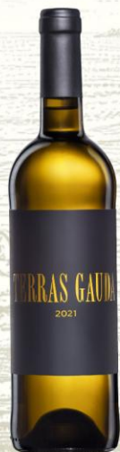
Terras Gauda Etiqueta Negra Vino Blanco

DO: Rías Baixas Uva: 70% Albariño, 25% Caiño Blanco y 5% Loureira Crianza: Crianza sobre lías Presentación: botella 750ml y 1,500ml