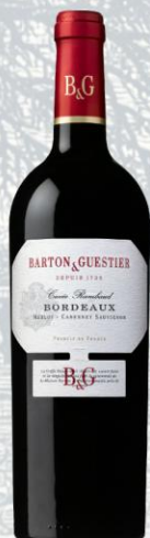
Bordeaux Vino Tinto

AOC: Bordeaux Uva: Merlot, Cabernet Sauvignon, Cabernet Franc Crianza: Crianza parcial en barricas Presentación: botella 750ml