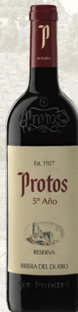
Protos Reserva 5o año Vino Tinto