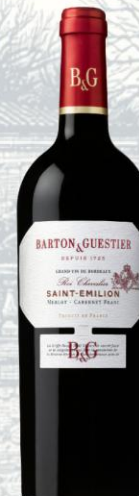
Saint-Émilion Vino Tinto

AOC: Beaujolais-Villages Uva: 100% Gamay Crianza: Crianza breve en acero inoxidable Presentación: botella 750ml