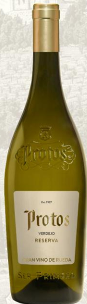
Protos Verdejo Reserva Vino Blanco

DO: Rueda Uva: 100% Verdejo Crianza: 3 meses sobre lías Presentación: botella 750ml