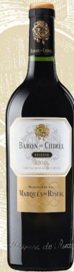
Marqués de Riscal Barón de Chirel Vino Tinto

DO: Rioja Uva: Tempranillo Crianza: 17 meses en barrica roble americano Presentación: botella 750 ml