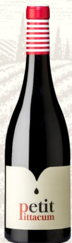
Petit Pittacum Vino Tinto

DO: Bierzo Uva: Mencía Crianza: 3 meses en barrica de roble Presentación: botella 750ml