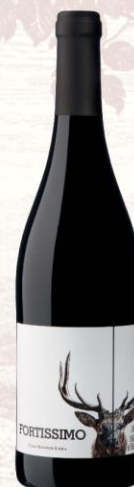
Fortissimo Vino Tinto

DOC: Vinho Regional Lisboa Uva: Castelão, Camarate, Tinta Miúda y Touriga Nacional Crianza: 3 a 4 meses en barricas de roble Presentación: botella 750ml