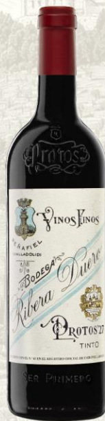
Protos 27 Vino Tinto de autor

DO: Ribera del Duero Uva: 100% tempranillo Crianza: 16 meses bodega de roble francés y 12 meses en botella