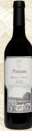
Marqués de Riscal Próximo Vino Tinto

DO: Rioja Uva: Tempranillo y otras Crianza: 16 meses barrica de roble francés Allier Presentación: botella 750ml