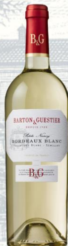
Bordeaux Blanc Vino Blanco

AOC: Bordeaux Uva: Merlot, Cabernet Sauvignon, Cabernet Franc Crianza: Crianza parcial en barricas Presentación: botella 750ml